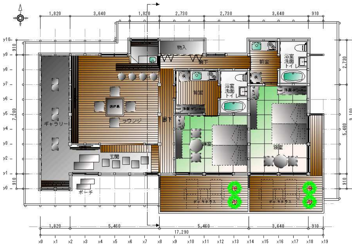
平面図 S = 1 / 100